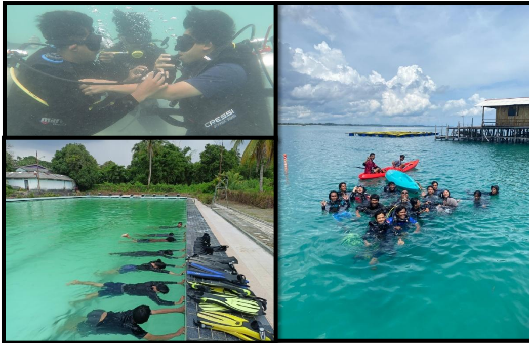
Gambar 3. Rangkaian kegiatan uji kompetensi mahasiswa tahun 2024

Kegiatan-kegiatan yang diselenggarakan ini bertujuan untuk mencapai Indikator Kinerja Utama yang ditargetkan. Ketercapaian target yang ditetapkan sangat berkaitan erat dengan program kerja yang disusun di dalam RKA KL tahun 2024 sebagaimana yang tercantum dalam Tabel 3 pada bab sebelumnya. Kedepannya agenda-agenda seperti ini akan menjadi prioritas dalam rangka peningkatan mutu lulusan di Fakultas Ilmu Kelautan dan Perikanan Universitas Maritim Raja Ali Haji. Kendala serta hambatan dalam memenuhi IKU 1.1 ini adalah pada proses tracer study . Alumni tidak semua yang mengisi kuesioner yang telah disebar, sehingga perlu dilakukan proses komunikasi secara langsung dengan cara ditelepon untuk mendapatkan data tersebut. Selain itu ketersediaan lapangan kerja yang terbatas di Kepulauan Riau serta masih banyak lulusan yang dalam proses seleksi CPNS dan PPPK tahun 2024. Data pendukung capaian IKU 1.1 dapat diakses pada link berikut ini.