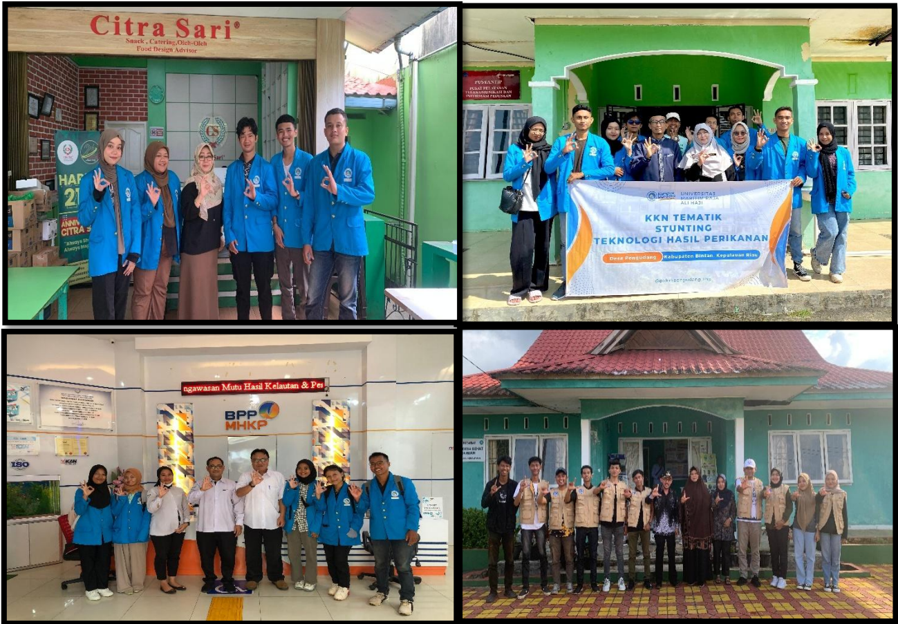
Gambar 4. Kolaborasi dalam rangka kegiatan MBKM

Kegiatan-kegiatan yang diselenggarakan ini bertujuan untuk mencapai Indikator Kinerja Utama yang ditargetkan. Ketercapaian target yang ditetapkan sangat berkaitan erat dengan program kerja yang disusun di dalam RKA KL tahun 2024. Kedepannya agenda-agenda seperti ini akan menjadi prioritas dalam rangka peningkatan mutu lulusan di Fakultas Ilmu Kelautan dan Perikanan Universitas Maritim Raja Ali Haji. Hambatan utama dalam pencapaian IKU ini adalah tidak semua mahasiswa memiliki kepercayaan diri yang tinggi untuk keluar kampus dalam mengikuti kegiatan MBKM yang telah dicanangkan.