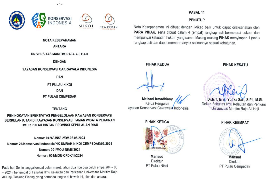
Gambar 8. Dokumen kerjasama FIKP UMRAH Tahun 2024

Dokumen kerjasama tersebut dapat diakses melalui link google drive Fakultas Ilmu Kelautan dan Perikanan berikut ini. https://s.id/IKU2024DATADUNG